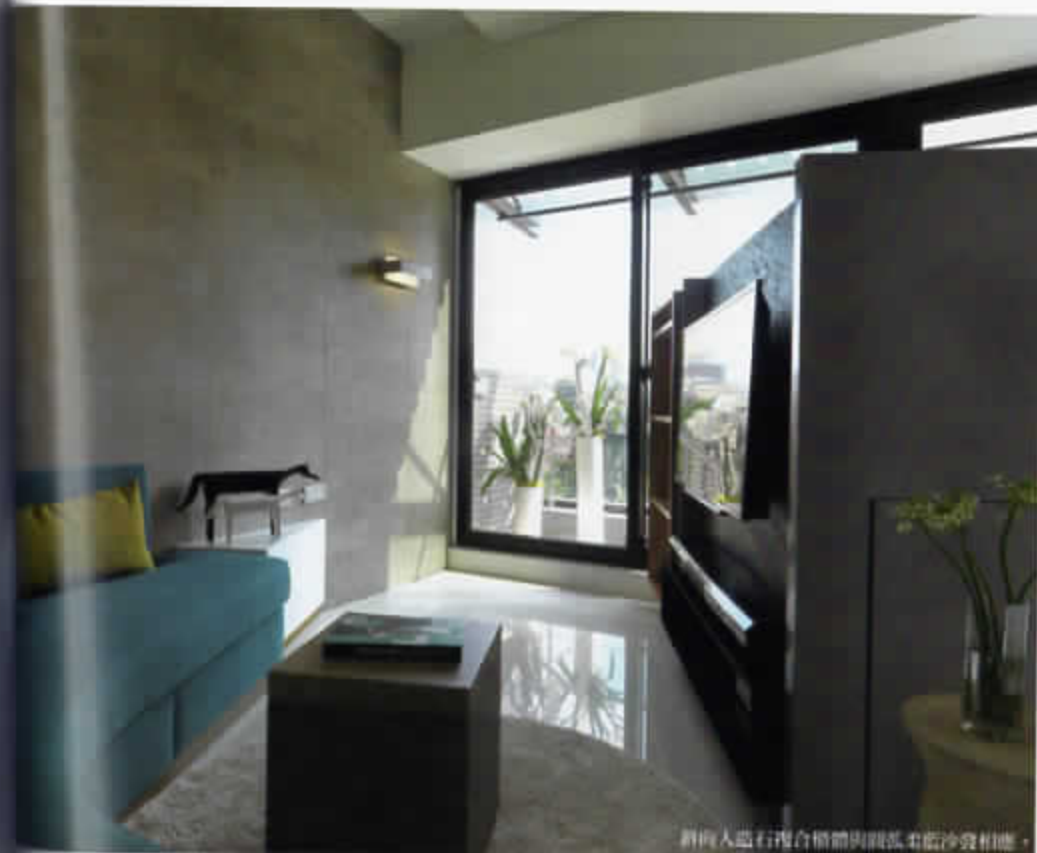
斜向人造石複合櫃體與圓弧柔適沙發相應。