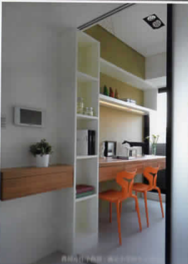
書房設計手稿圖，展示小空間大創意。