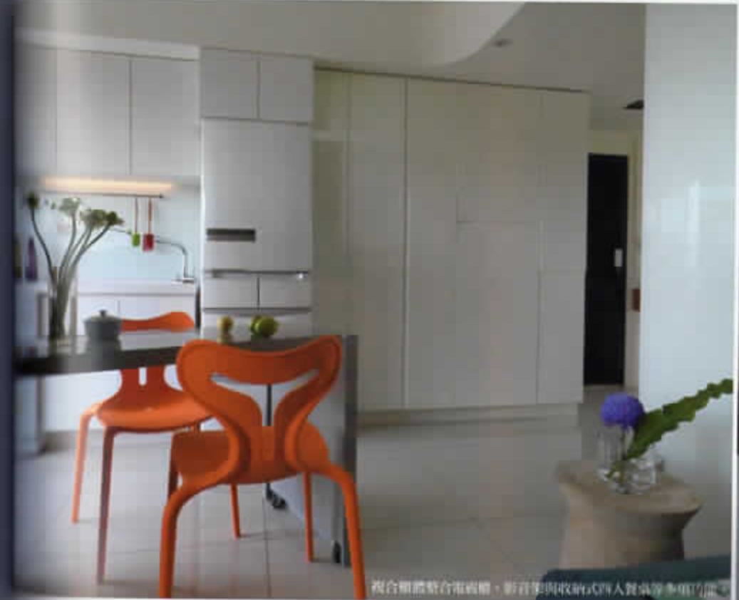
複合櫃體整合電視櫃、影音架與收納式餐桌等多項功能。